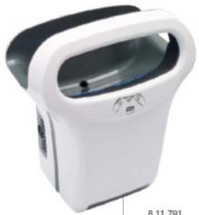
8 11 791