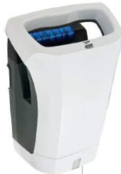
8 11 962