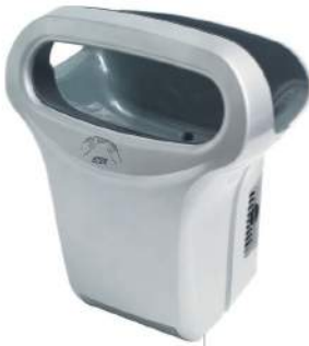
8 11 822