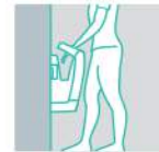
DEPÓSITO A VACIAR