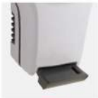
DEPÓSITO A VACIAR