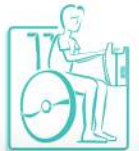
ADAPTADO A LAS PERSONAS CON MOVILIDAD REDUCIDA