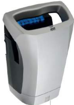
8 11 963